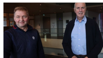
«Slik skal de kvitte seg med kriminalitet i arbeidslivet» — Sandnesposten