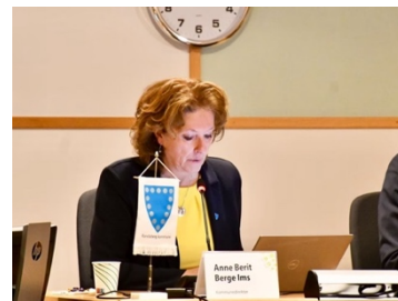
«Innstillingen sa først nei – men bruker noen kroner på Fair Play Bygg likevel» — Randaberg24.no

– Vi jobber på bakgrunn av kunnskap og statistikk. Og statistikken viser at faren for gjentakelse er stor hos personer som har gått konkurs tidligere. Da er det viktig for oss å følge med – spesielt for å ivareta ansatte og de andre selskapene som er involvert.