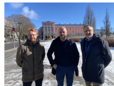
«Sammen for fair play i byggebransjen» — Haugesund kommune